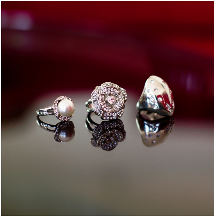
Кольцо с жемчужиной. Кольцо в виде розы со стразами Jules. Кольцо And Lovely со стразами в виде звезд.