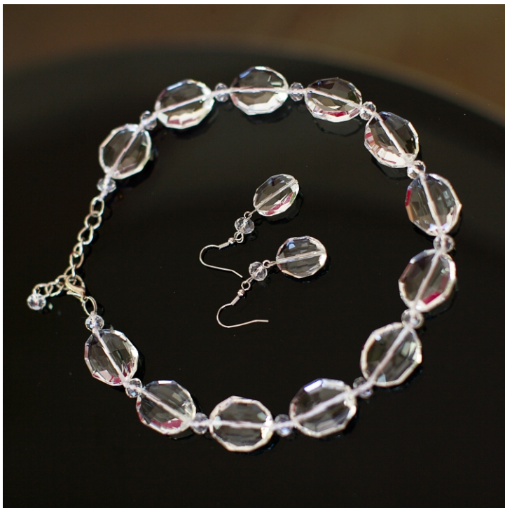
Набор Hush. Серьги и Кулон.