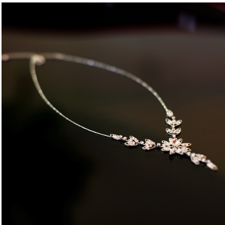
Колье с цветком и стразами.