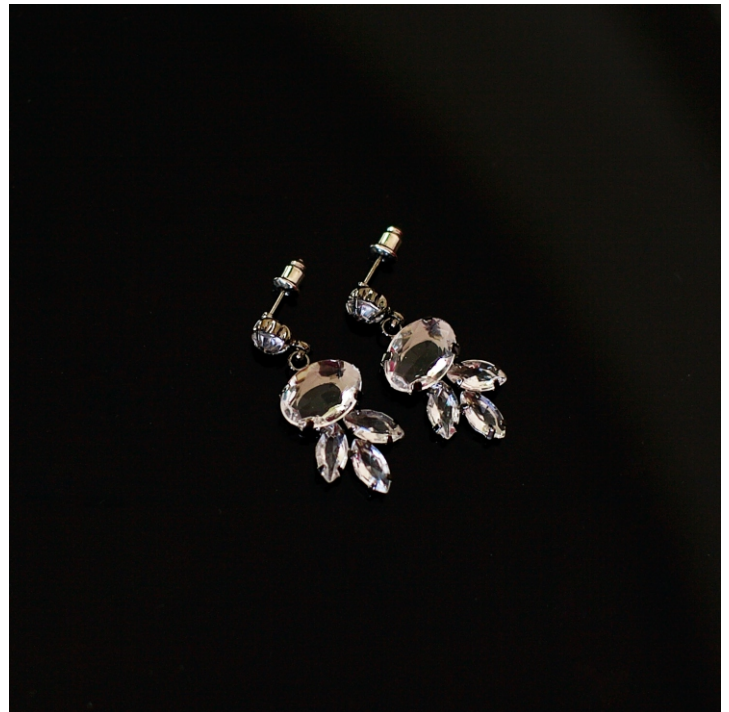
Серьги металлик со стразами.