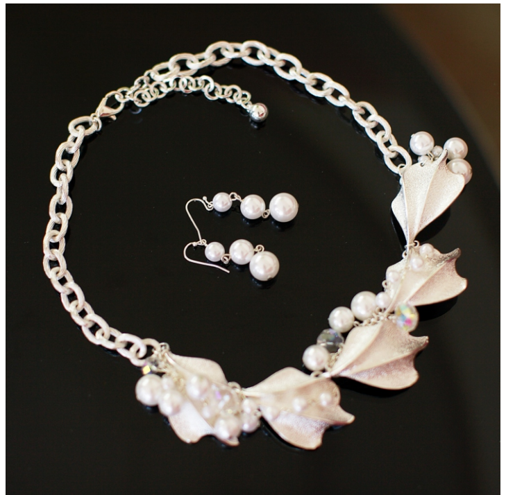
Набор из хрусталя Hush. Колье и Серьги.