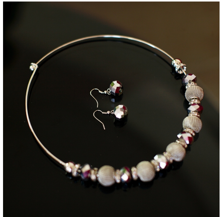
Набор Davinci на металлической основе. Серьги и Колье.