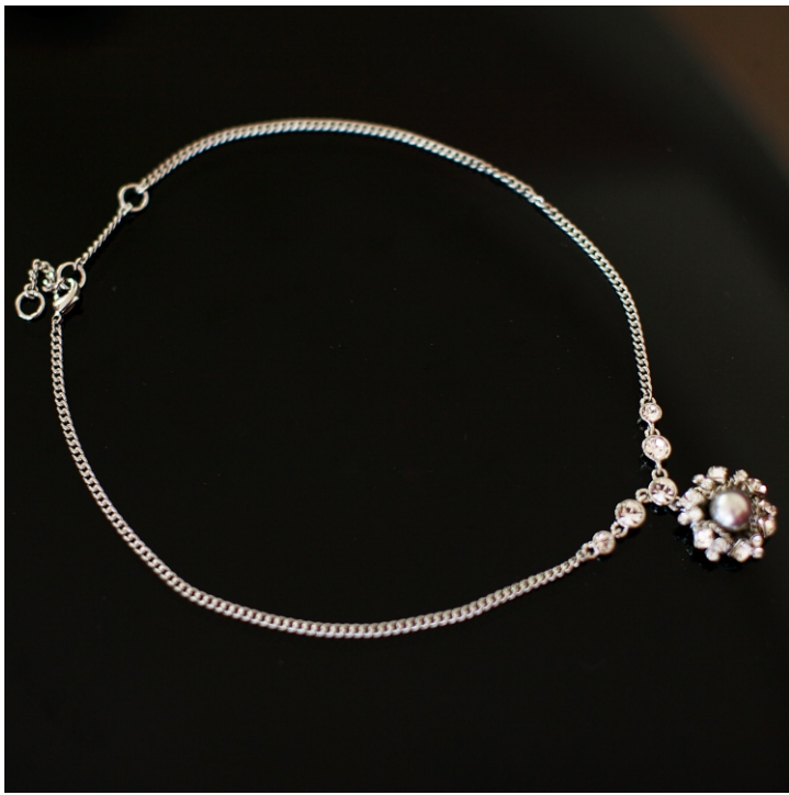
Подвеска в виде цветка с жемчужиной.