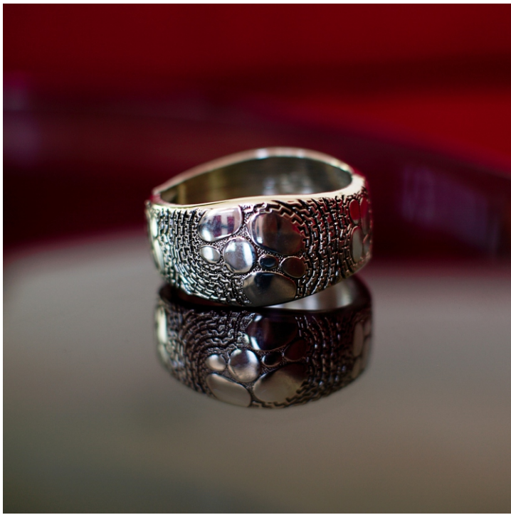
Браслет металл с декоративным узором.